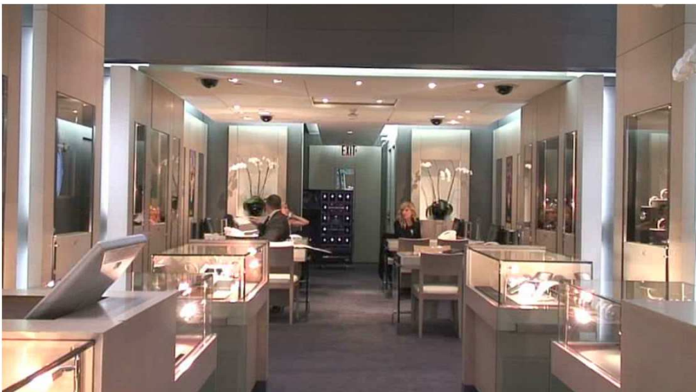
Photographie 1 - Monde feutré

Les boutiques de luxe marquent une coupure par rapport à l'extérieur. Y entrer signifie pénétrer dans un monde feutré qui valorise les codes de la bienséance. Les déterminants physiques de cette séparation sont très souvent présents. Il n'est pas rare de voir des vigiles à l'accueil du magasin qui, sans assurer un filtrage des entrées, accréditent l'idée qu'il faut « montrer patte blanche » pour pénétrer dans la boutique, et qu'il existe un mode d'expression particulier à l'intérieur. Dans la boutique, l'atmosphère du lieu est conçue pour dégager une sérénité qui tranche avec l'agitation du dehors. Les matériaux sont nobles, le sol est recouvert de parquet ou de moquette, la lumière est légèrement tamisée, la musique diffuse des titres « lounge » et mélodieux (photographie 1). Les vendeurs, en costume, ne sont pas agressifs, attendant debout à l'arrière plan, ou occupés à des tâches de polissage et d'organisation de l'espace. Pénétrer dans la boutique revient à entrer dans un espace de jeu au sens de Caillois (2006), à savoir un univers réservé, clos, protégé, un espace pur. L'extérieur est comparativement une sorte de jungle, où il faut s'attendre à mille périls.