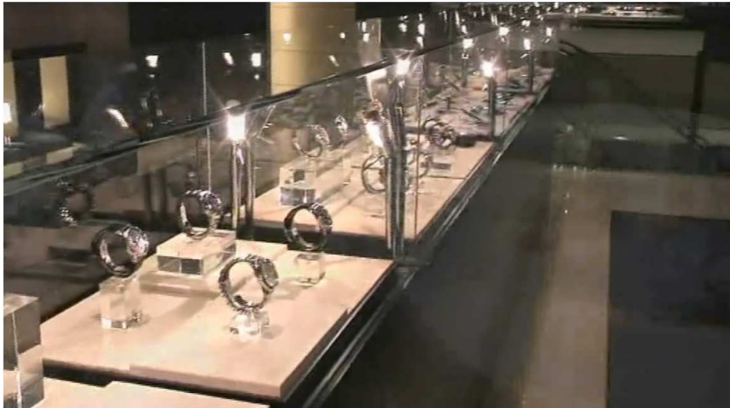
Photographie 2 - Mise en scène esthétique

Le transfert de sens du client au produit s'effectue également via un discours scientifique qui charge le produit d'attributs techniques (photographie 3). Davantage que les cartels dans le magasin, c'est souvent le discours des vendeurs qui assume cette charge technique, via des détails quantitatifs sur le nombre de carats d'un diamant ou mécaniques sur le dispositif de remontage d'une montre. Parfois, la mise en scène du magasin accrédite cette expertise technique autour de l'objet :