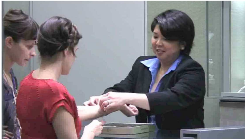
Photographie 4 - « L'essayage »

L'acte de déverrouiller les montres sous vitrine marque ici la rupture physique et symbolique du transfert de sens vers le client. L'essayage se prépare, et n'est pas laissé à la discrétion du client. La vitrine rend l'objet inaccessible et marque le privilège. C'est aussi le vendeur qui, par son rôle d'intermédiaire, donne une valeur sensible à l'objet avant même qu'il ne soit sur le corps du client. Il peut, outre les signes du cérémonial (plateau, lieu à l'écart), user de gestes précautionneux pour manipuler l'objet, et rendre le transfert de valeur d'autant plus tangible.