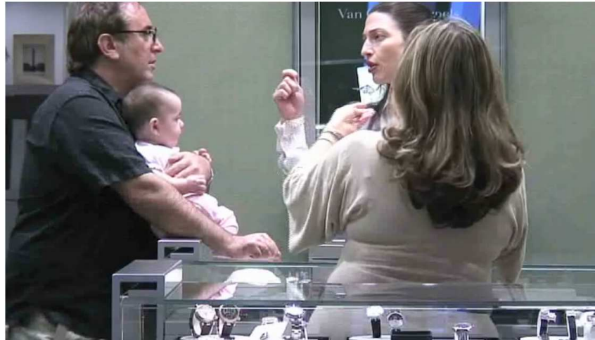
Photographie 5 - Ecart entre l'utopie dans la boutique et le comportement de la clientèle

Le moindre grain de sable vient dès lors a contrario souligner le contraste, alors que ces situations peuvent faire partie intégrante de l'expérience du lieu dans un magasin traditionnel. Par un effet de mimétisme, les exigences du client sont renforcées par la perfection affichée du lieu.